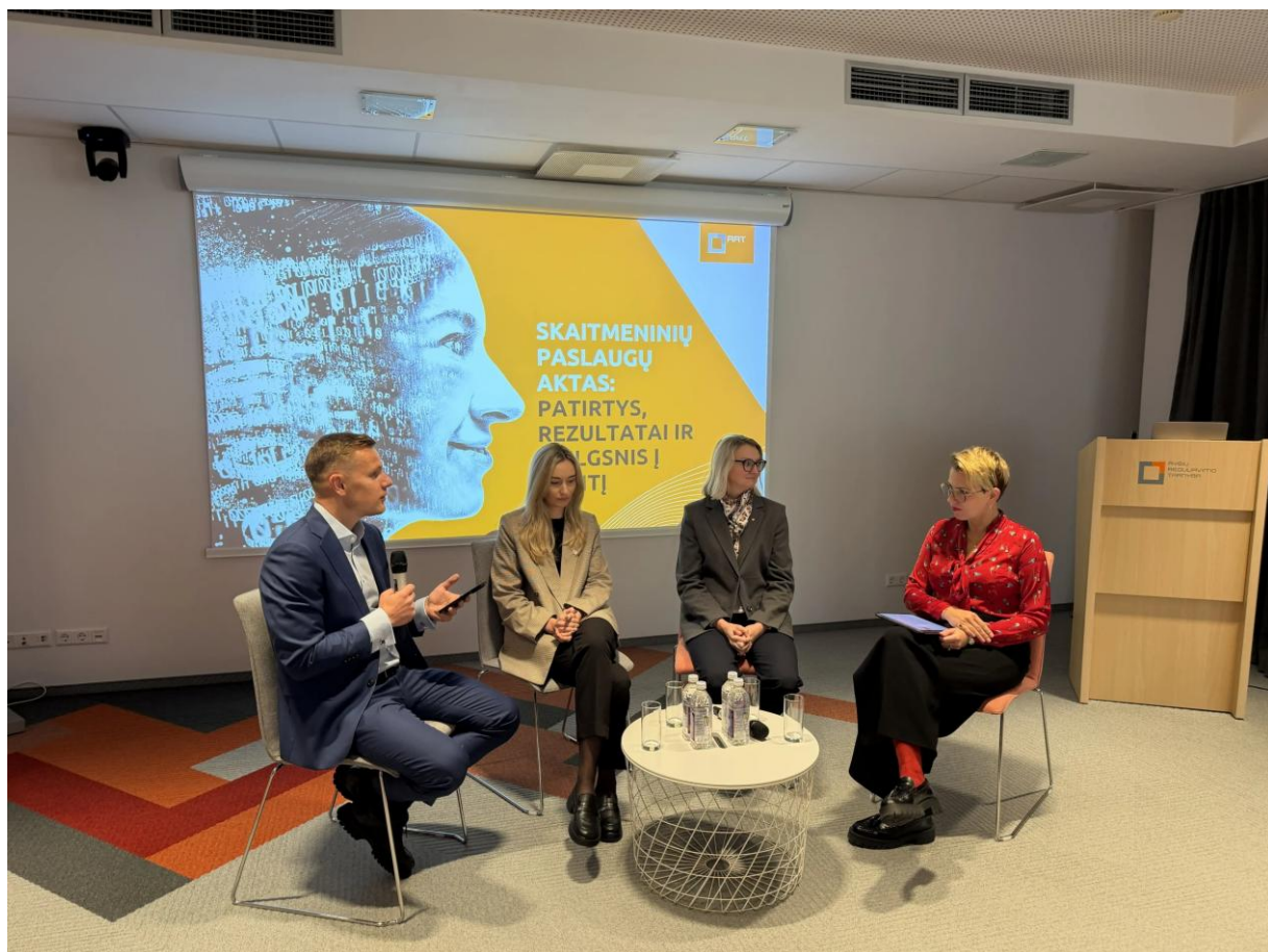
1 pav. Tarpinstitucinio renginio metu vykusi diskusija – SPA: Patirtys, rezultatai ir žvilgsnis į ateitį

Per 2025 m. RRT darbuotojai suteikė daugiau kaip 70 konsultacijų rinkos dalyviams – paslaugų teikėjams, akademinėi bendruomenei, Lietuvos institucijoms bei kitoms suinteresuotosioms šalims. Pagrindinis šių susitikimų tikslas buvo šviesti SPA ekosistemos dalyvius apie SPA numatytus mechanizmus bei suteikiamas teises.